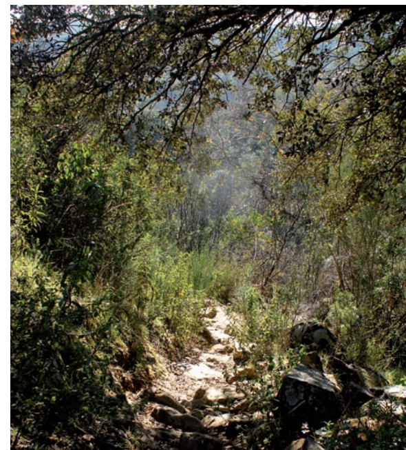
Sendero del Alto del Chorrillo.

El uso tradicional de estos caminos como vía de comunicación ha dado paso a una utilización más vinculada a actividades lúdicas y deportivas. Su propio valor patrimonial, unido a la belleza de los paisajes que atraviesa, hacen de ellos uno de los principales recursos turísticos de la Sierra. En la actualidad, más de 600 kilómetros de