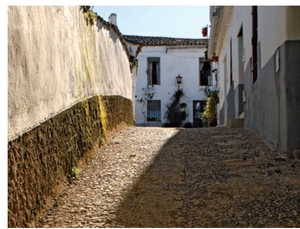
Calle empedrada en Cortelazor.

La naturaleza ha recreado en el Parque Natural Sierra de Aracena y Picos de Aroche -reconocido por la Carta Europea de Turismo Sostenible- estampas de incomparable belleza y valor ecológico, que las gentes de estas tierras han sabido mantener intactas hasta nuestros días. El visitante podrá disfrutar de este entorno a través de una cuidada oferta de hoteles rurales y restaurantes, que harán de su recorrido por los caminos de la sierra una experiencia inolvidable.