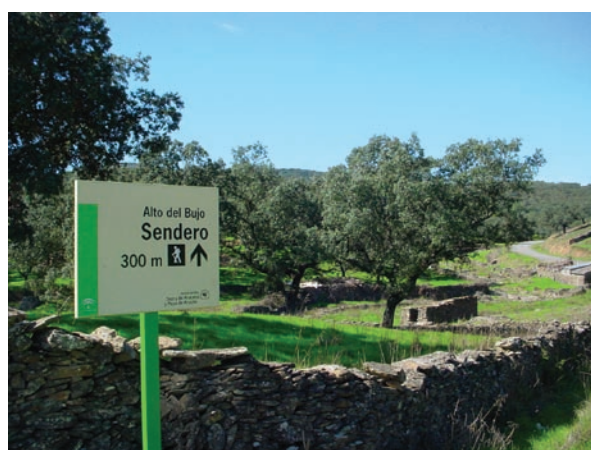
Inicio del sendero del Alto del Bujío.

Sorprenderá la riqueza del patrimonio cultural, arqueológico y arquitectónico de los pueblos y aldeas que jalonan cada una de las rutas propuestas. Fortalezas medievales dominando el horizonte, iglesias bellamente ornamentadas, o monumentos de lo cotidiano como fuentes, ermitas, abrevaderos o molinos fluviales pueden ser contemplados en casi cualquier rincón serrano