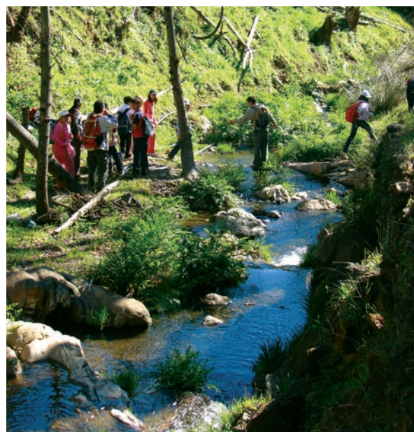
Riviera de Montemayor.

La naturaleza ofrece en la Sierra de Aracena y Picos de Aroche un espectáculo cromático único en cada estación del año. Las masas boscosas de castaños centenarios, que se concentran sobre todo en la zona central, más elevada y húmeda, aportan una paleta de diversas tonalidades rojizas, ocre y verdes. En los márgenes de los