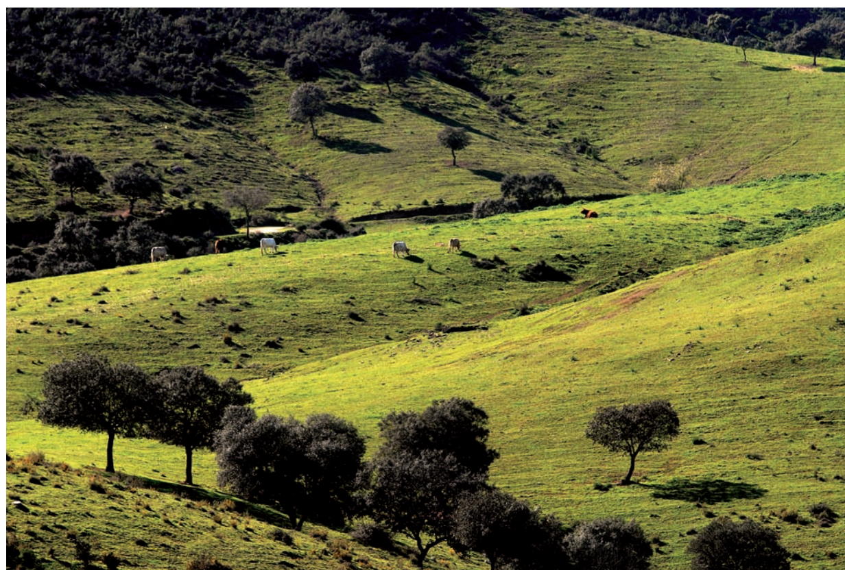
La dehesa es uno de los paisajes más típicamente serranos.

Todo ello, unido a una cultura y tradición basadas en la explotación sostenible de los recursos naturales, convierten a esta sierra en una de las áreas boscosas más extensas y mejor conservadas de la región mediterránea. La dehesa es el ecosistema más representativo, y consiste en el aclareo, realizado por la mano del hombre a lo largo de los siglos, del bosque original. El resultado lo conforman grandes extensiones cubiertas de encinas y alcornoques, con manchas de quejigos en las umbrías y vaguadas. Esta sabia alianza entre la necesidad humana y la naturaleza constituyó en el pasado, y sigue siéndolo en la actualidad, una forma racional de aprovechamiento ganadero, forestal y agrícola. En estas dehesas de la serranía onubense se cría de forma extensiva, o en "montanera", el cerdo ibérico. Un cuidadoso proceso de secado y curación de sus carnes da lugar a los famosos jamones y chacinas con Denominación de Origen Jamón de Huelva. El principal aprovechamiento forestal de la dehesa es la saca de corcho del alcornoque, que se pro-