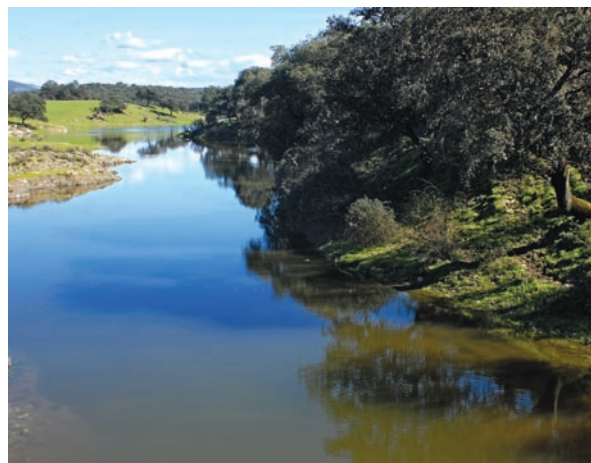
Riviera de Huelva.

Se trata de un vasto territorio con más de 1.800 km 2 , que cuenta con el 60% de su superficie protegida por la importancia y calidad de sus valores naturales y culturales. La comarca está constituida por un conjunto de sierras de suave elevación, donde los picos más altos no llegan a los mil metros de altitud, y entre las que fluye una tupida red de ríos, arroyos y riachuelos de gran belleza y valor ecológico. Esta bendición en forma de agua tiene su razón en la abundancia de precipitaciones anuales que concentra toda la zona, y que ha dado lugar a una tradicional arquitectura fluvial en forma de lievas, azudes, molinos o lavaderos.